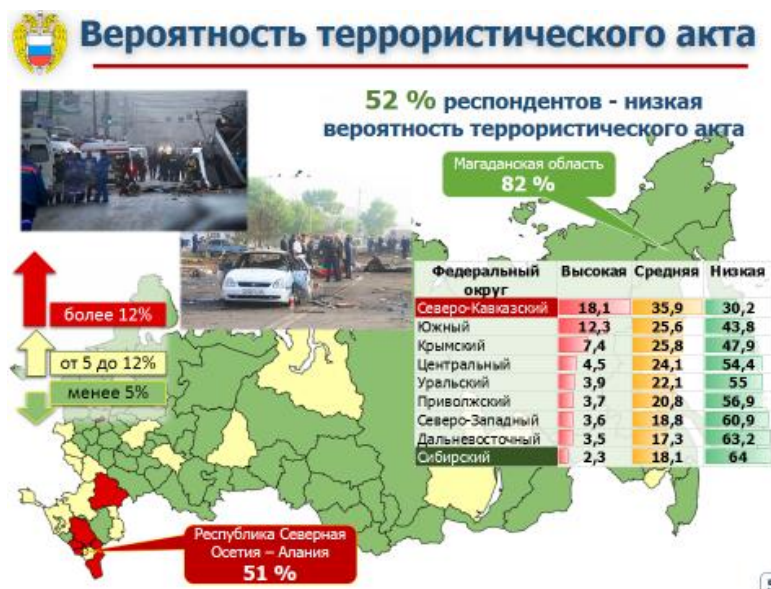
Рис. 1. Оценка респондентами вероятности террористического акта в месте своего проживания (по результатам опроса населения Российской Федерации в апреле – мае 2015 г.), %