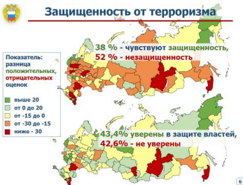
Рис. 2. Оценка респондентами защищенности от террористических актов (по результатам опроса населения Российской Федерации в апреле – мае 2015 г.), %

43,4% опрошенных жителей Российской Федерации уверены в том, что органы власти предпримут все меры, чтобы защи-