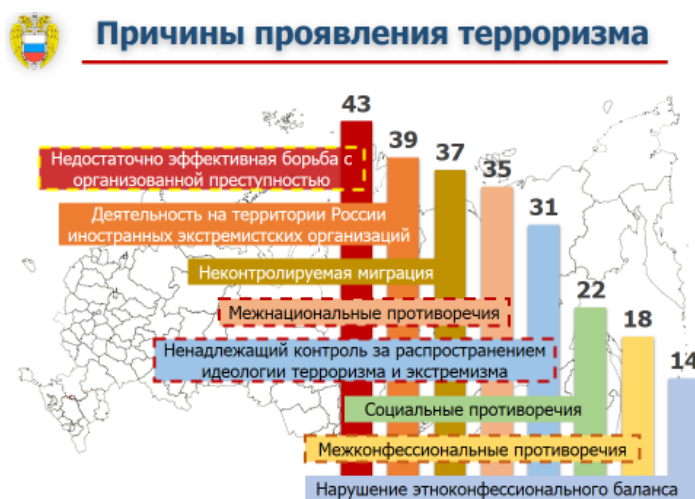
Рис. 4. Причины терроризма (по мнению опрошенных россиян) (по результатам опроса населения Российской Федерации в апреле – мае 2015 г.), %

Что касается чувств, которые испытывают опрошенные по отношению к террористам, то более 45% респондентов испытывают злость, еще около 40% – желание им противостоять, однако при этом каждый третий опрошенный испытывает страх перед террористами, а каждый пятый – бессилие. Следует отметить, что прослеживается тенденция к увеличению доли респондентов, желающих противостоять террористам.