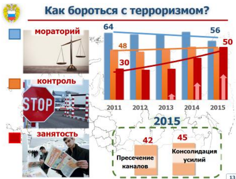
Рис. 7. Меры борьбы с терроризмом (по мнению опрошенных россиян) (по результатам опроса населения Российской Федерации в апреле – мае 2015 г.), %

Граждане все чаще, а в 2015 г. это уже половина опрошенных (50%), обращают внимание на необходимость обеспечения