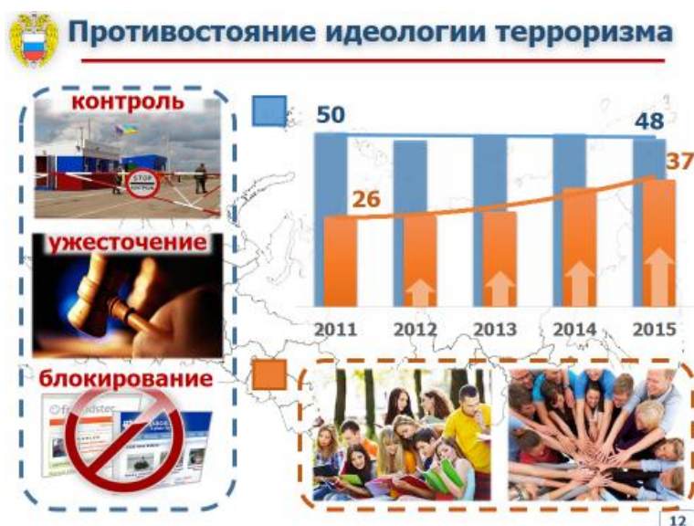
Рис. 6. Меры противодействия идеологии терроризма (по мнению опрошенных россиян) (по результатам опроса населения Российской Федерации в апреле – мае 2015 г.), %

Значительная часть (48%) респондентов считают, что наибольший эффект в борьбе с распространением идеологии терроризма даст усиление контроля на границах Российской Федерации и регионов с высоким уровнем террористической активности с целью недопущения провоза и распространения материалов террористической и экстремистской направленности (рис. 6).