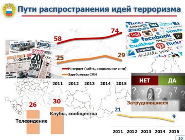
Рис. 5. Пути распространения терроризма (по мнению опрошенных россиян) (по результатам опроса населения Российской Федерации в апреле – мае 2015 г.), %

Значительная часть (48%) респондентов считают, что наибольший эффект в борьбе с распространением идеологии терроризма даст усиление контроля на границах Российской Федерации и регионов с высоким уровнем террористической активности с целью недопущения провоза и распространения материалов террористической и экстремистской направленности (рис. 6).